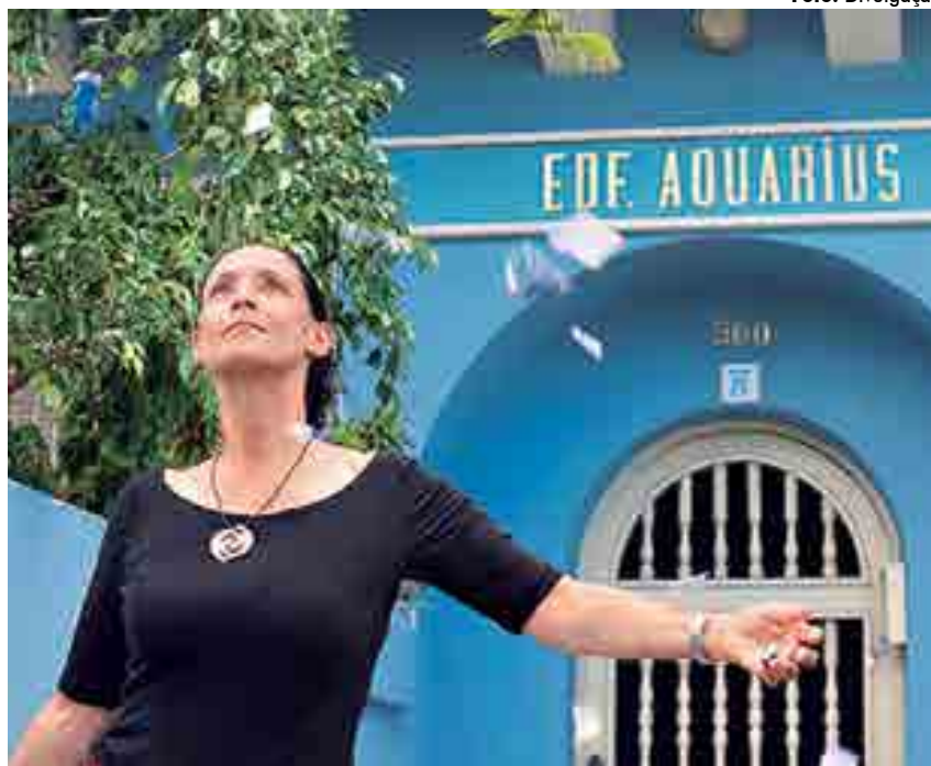
A atriz Sônia Braga é a protagonista do filme Aquarius, de Kleber Mendonça Filho

No circuito, o público pode assistir gratuitamente longas e curtas-metragens que acontecem em seis estados, dentre eles a Paraíba. Os filmes já estão sendo exibidos em salas de cinema,