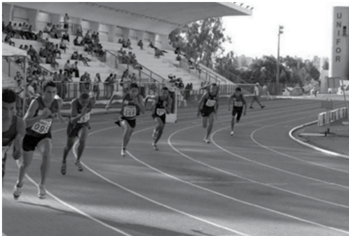
As provas serão disputadas entre os dias 30 de setembro e 1 de outubro