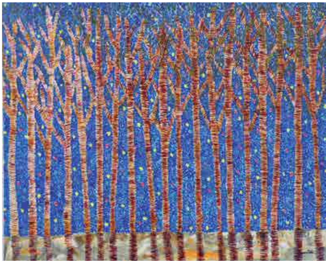
A variedade de cores pode ser percebida na tela de Denise Costa, que retrata a natureza de forma subjetiva