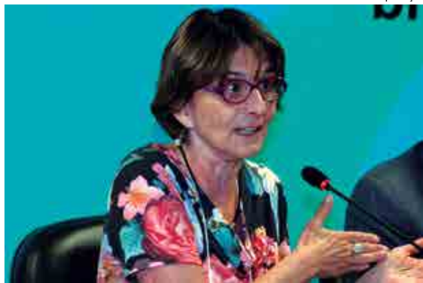
A palestrante Helena Bonciani Nader é titular na Academia Brasileira de Ciências

Ciclo de Debates Contemporâneos da Paraíba, promoverá palestras até o mês de dezembro, também vai discutir assuntos como, por exemplo, A invenção e a ‘reinvenção necessária’ do Nordeste.