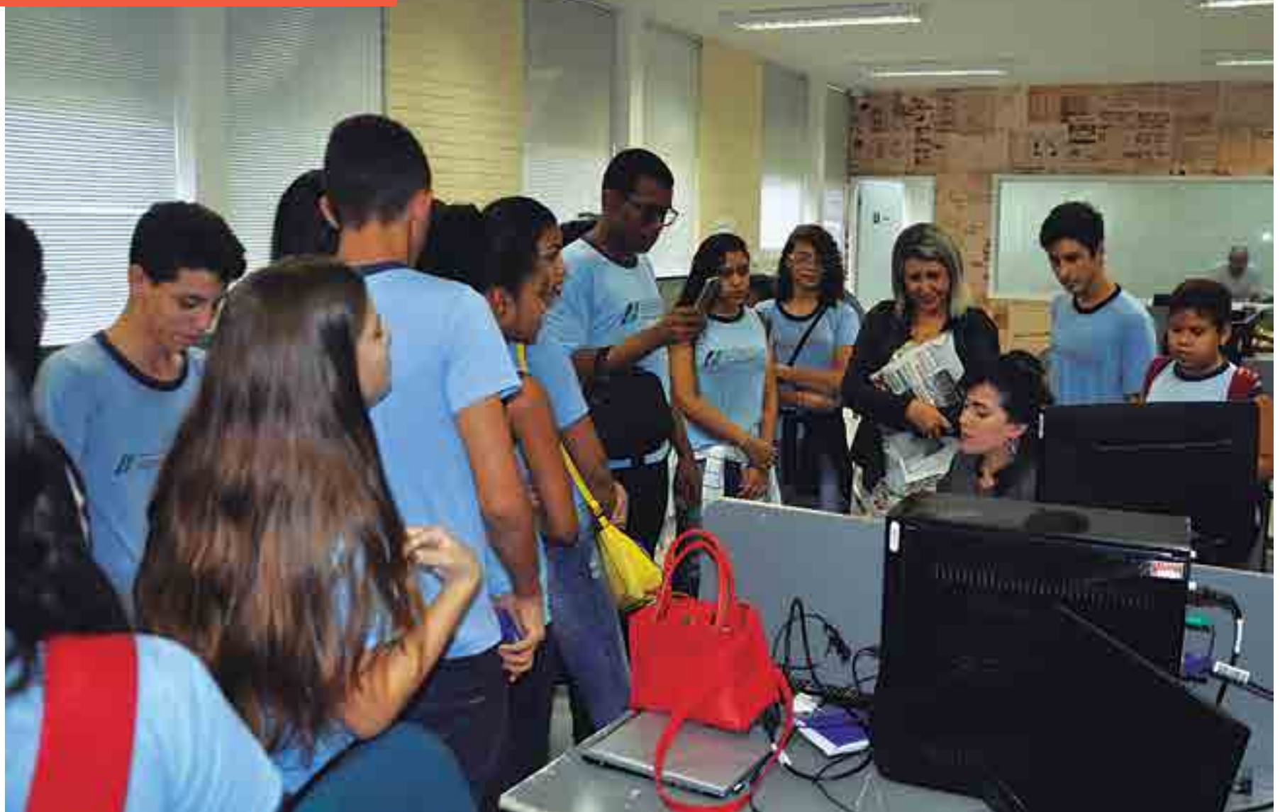
Estudantes do 8º ano do Sesquicentenário tiveram o primeiro contato com todas as etapas de preparação do jornal impresso, desde a produção na redação até a impressão