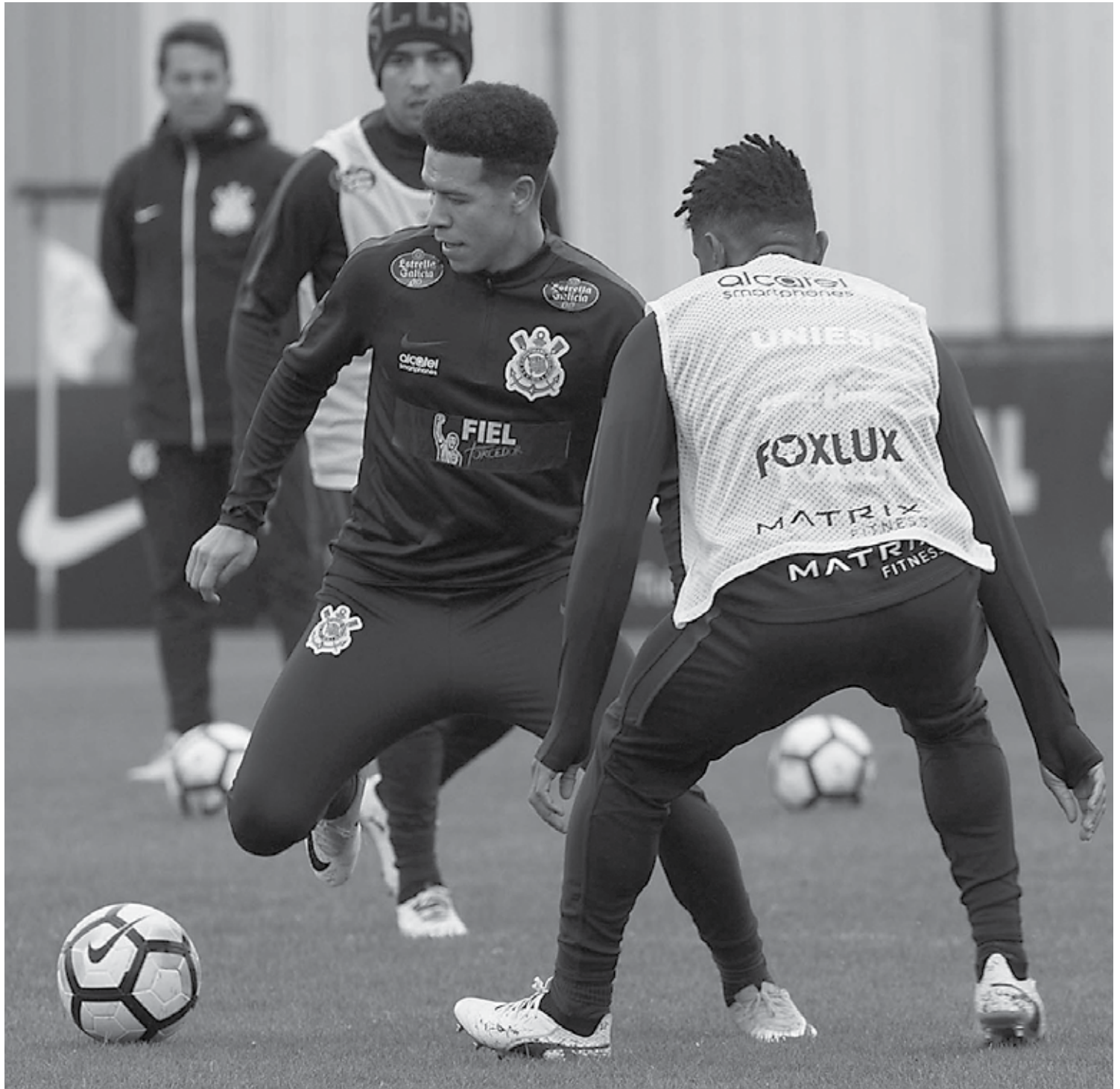
Líder absoluto do Campeonato Brasileiro, o Corinthians cumpre jogo que foi adiado da 20ª rodada e terá alguns desfalques contra a Chapecoense

O Corinthians, portanto, levará a seguinte equipe ao gramado da Arena Condá: Cássio; Fagner, Léo Santos, Pedro Henrique e Moisés; Gabriel, Maycon, Marquinhos Gabriel, Rodriguinho e Romero; Jô.