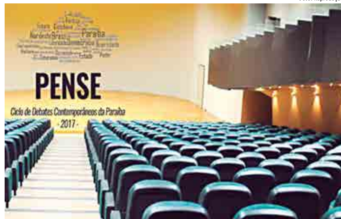
Evento acontece na sala de concertos Maestro José Siqueira, no Espaço Cultural, e a entrada é gratuita