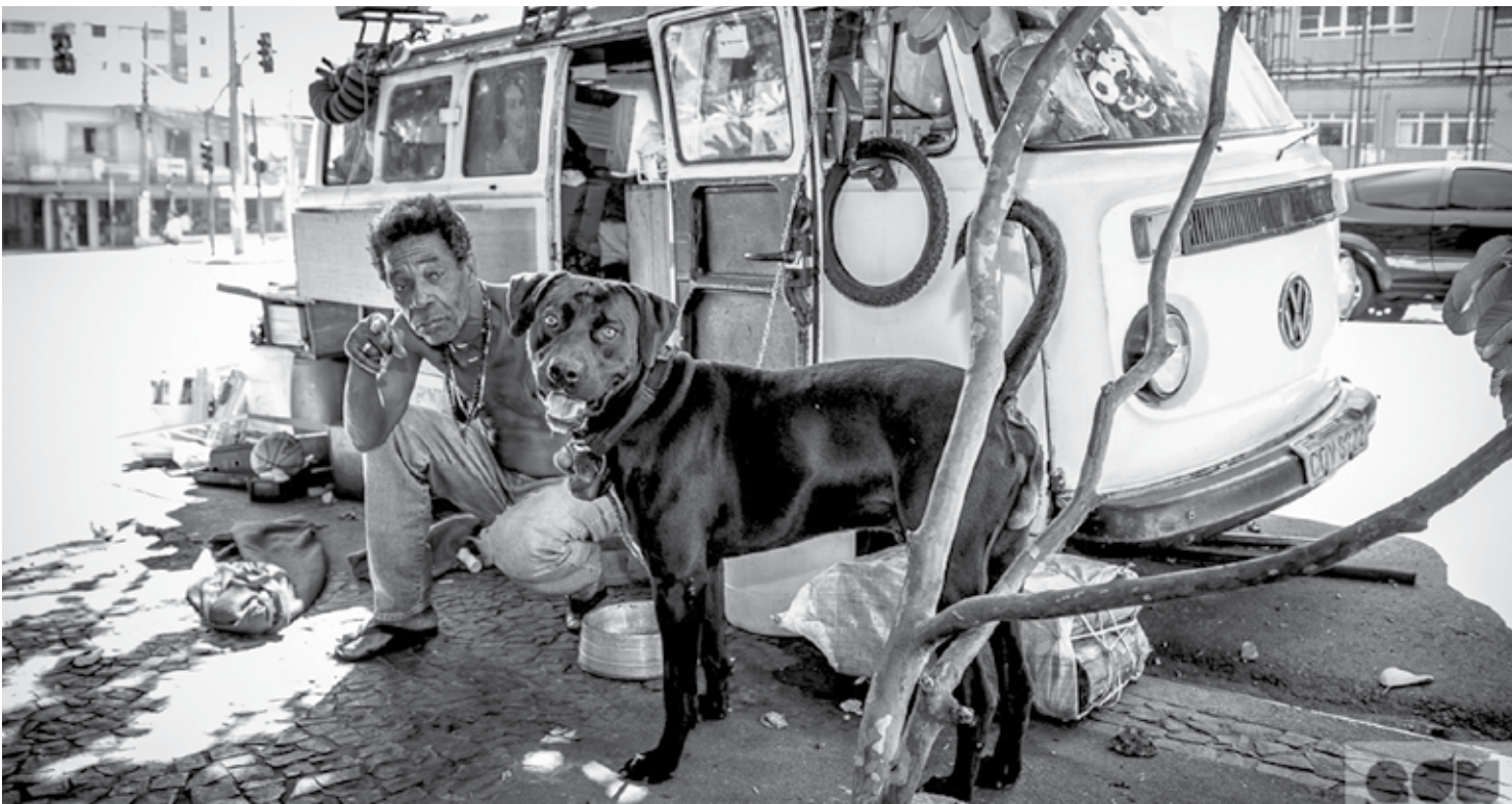
Moradores de rua de Lisboa estão sendo assistidos pelo projeto Housing First, que vem conseguindo mudar a realidade de pessoas em situação de risco

Artigo Evaldo Gonçalves Membro da APL e do IHG