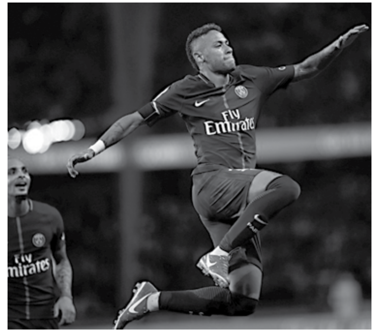
Negociação do brasileiro para o PSG continua rendendo no Barcelona

de contrato assinado pelas partes até 2021. Maior contratação da história do futebol, a saída de Neymar do Barcelona para o PSG foi motivo de polêmicas entre os dirigentes catalães. Na temporada passada, o craque brasileiro negociou e acertou a renovação com o clube até junho de 2021.