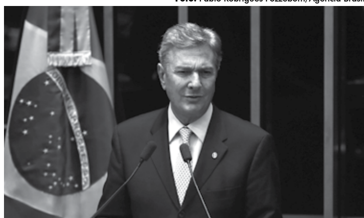
Collor é acusado de receber R$ 29 milhões em propina da BR Distribuidora